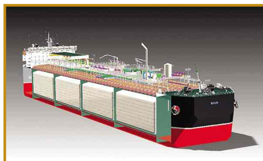
Maquette d'un "Floating Storage Regazéification Unit"

Cette expansion continue et silencieuse du GNL est une chance pour le secteur du shipping , en ce qu'elle accompagne et renforce la capacité du monde du shipping à se perfectionner, à être à la pointe de la technologie, de la lutte contre la pollution et contre le réchauffement climatique, ainsi que de l'affirmation d'une sécurité optimale.