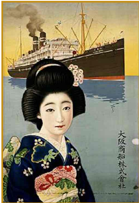
Cette jeune-fille en kimono bleu marine présente "Horai Maru" de 9192 GT, acheté à l'étranger en 1923 pour la ligne Kobe-Keelung.