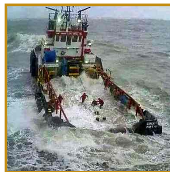
Navire supply qui "fait les ancres" (Running anchors) dans du temps moyen.

● La fin de vie d'un super tanker le "Front Driver" qui s'échoue volontairement sur la plage d'un chantier de démolition près de Karachi au Pakistan, le travail de démantèlement (v. 20'41") : https://tinyurl.com/ybw6okkg